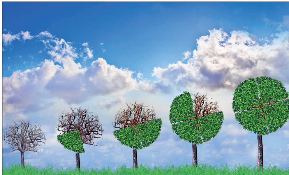
Une formation en progression croissante, axée sur la transition durable.

d'accélérer cette transition verte: les établissements financiers, les asset managers , l'ONU, les ONG et autres organisations internationales, auxquels s'ajoutent un secteur académique de pointe, de grandes fondations privées et des autorités politiques engagées. C'est aussi à Genève qu'a été lancé, en 2019, Building Bridges, l'initiative conjointe des partenaires suisses et internationaux pour un modèle économique durable, qui tiendra son troisième sommet dans la cité en octobre prochain».